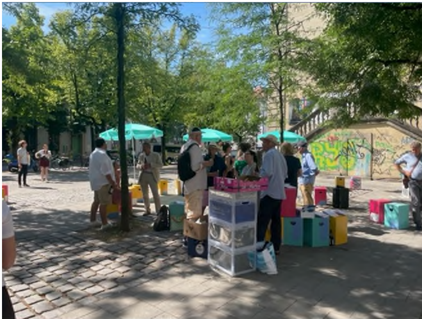
Baukulturfrühstück vor dem Bunker

Zwölf Klassen aus ganz Bayern nutzten vor den Sommerferien das Workshop-Angebot der Bayerischen Architektenkammer und beschäftigten sich mit Brückenbau, bauten Stadtmodelle, gossen Beton, inspizierten historische Dachwerke oder untersuchten ihre Schulhäuser energetisch.