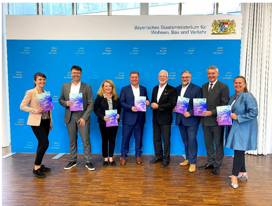
Übergabe der Publikation „Sustainable Bavaria“