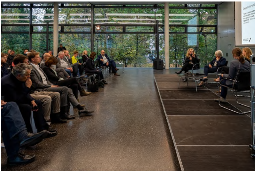
Wohnprojektetag am 21.10.2022

Alle Formate konnten erfolgreich durchgeführt werden. Lediglich das Angebot „More than Bricks!“ (29./30.09.2022) musste bedauerlicherweise mangels Teilnehmerinteresse abgesagt werden.