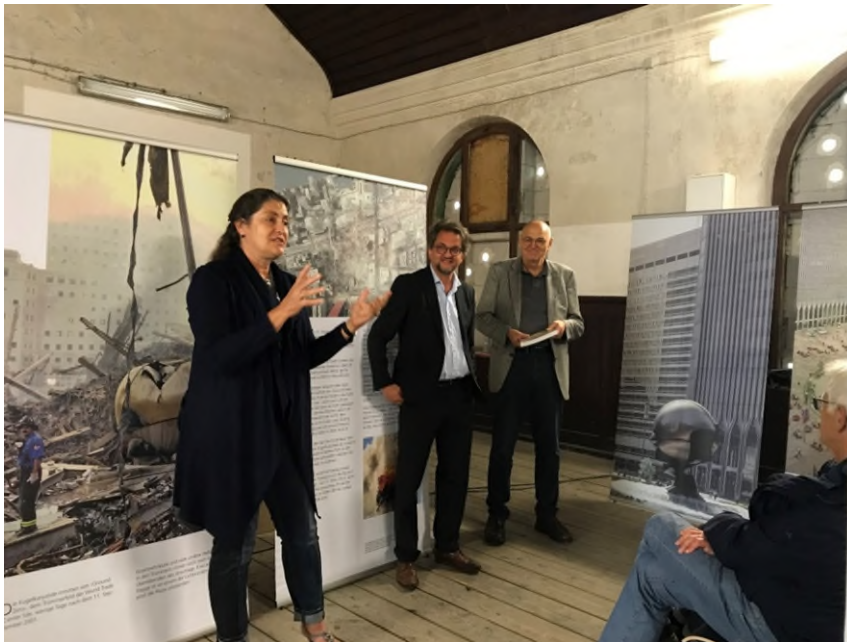
Ausstellungseröffnung im Reglerhaus für Baukultur, Kempten; Foto: Franz Schröck

Nach Stationen in Koenigs ehemaligem Atelier in der Kugelhalle am Gansberg, im Treffpunkt Architektur Mittel- und Oberfranken in Nürnberg sowie anlässlich der Eröffnung des Treffpunkts Architektur Oberbayern im Kreuzgang von Kloster Seeon war diesmal das architekturforum allgäu Gastgeber. Neben der fotografischen Dokumentation der Geschichte von Koenigs Kugel und Tafeln, die Koenigs Wirken als Professor für Plastisches Gestalten an der TU München beleuchten, waren diesmal auch studentische Arbeiten zu sehen, die in Koenigs Seminaren entstanden sind. Ein ausführlicher Bericht erschien im Regionalteil Bayern des DAB 10/2022. Nimmt man die vier Ausstellungsorte zusammen, so dürften die Ausstellung insgesamt rund 1600 Besucher gesehen haben. Im Jahr 2024 wird der 100. Geburtstag Fritz Koenigs gefeiert – und hier möchte der Freundeskreis Fritz Koenig seine Rolle als Lehrer an der TU München noch einmal deutlicher herausarbeiten.