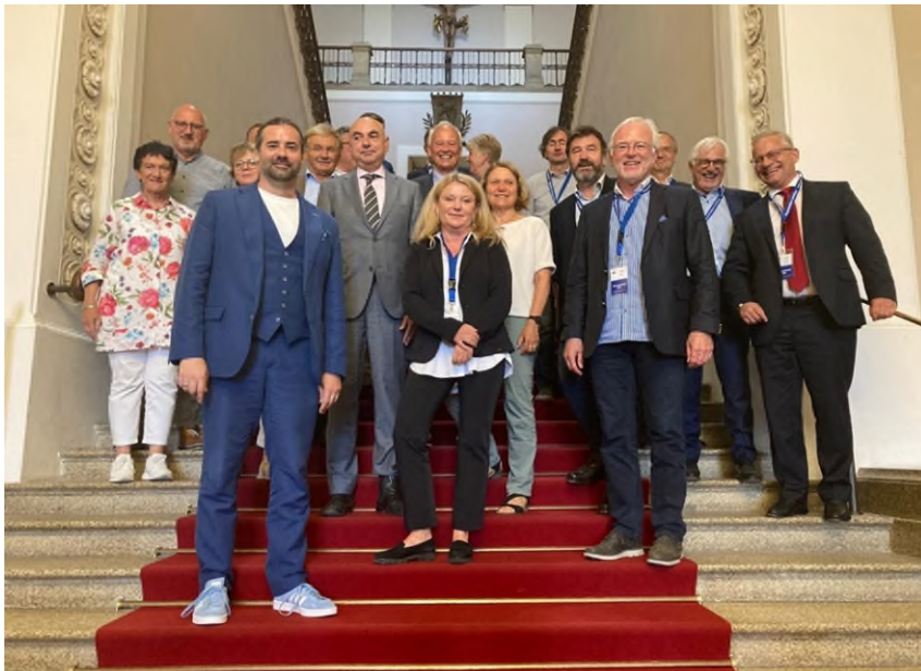
Die Teilnehmerinnen und Teilnehmer des Fachgesprächs am 28.06.2022 im Bayerischen Landtag