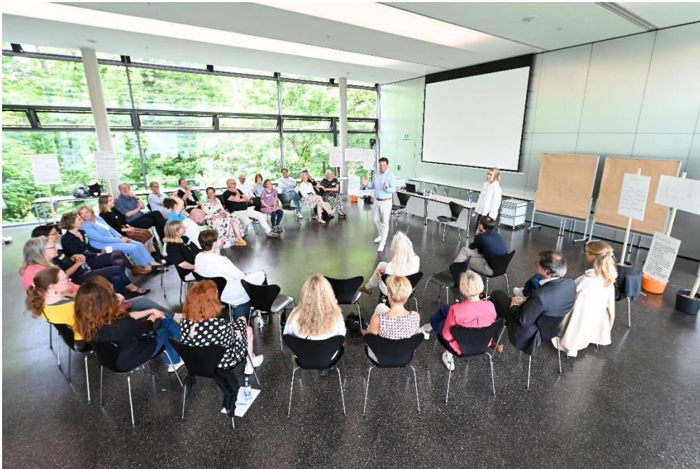
Kammervorstand und Mitarbeiter/innen der Geschäftsstelle im Plenum der Vorstandsklausur am 23.05.2022 im Haus der Architektur