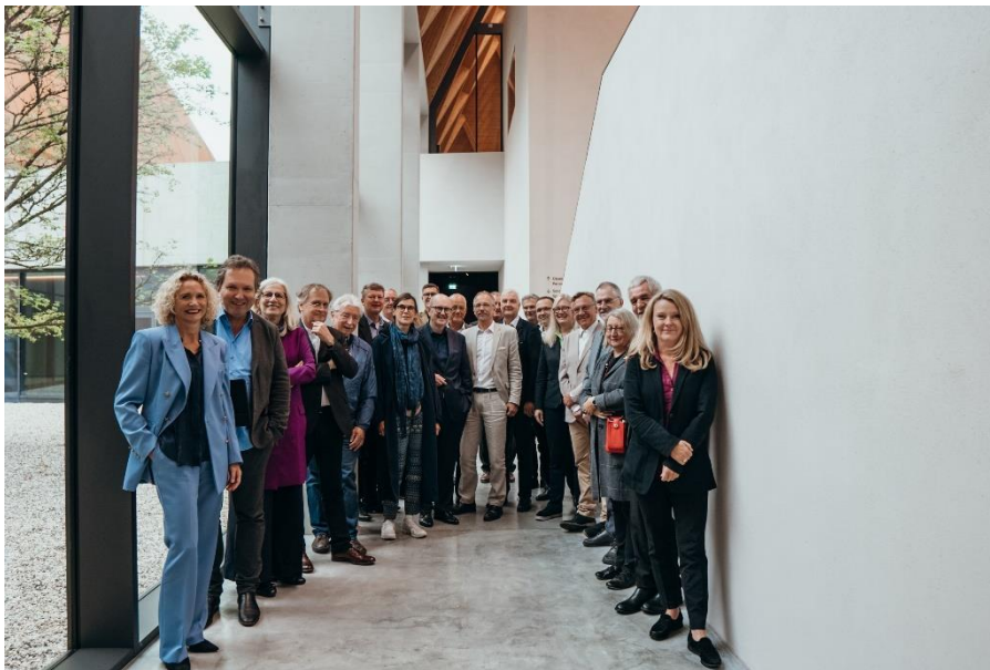
Der BAK-Vorstand in Berlin

Von 19. bis 21.05.2022 fand die diesjährige BAK-Vorstandsklausur in Schloss Pillnitz bei Dresden statt – erstmals unter Führung des im letzten Jahr neugewählten BAK-Präsidiums, an dessen Spitze die Münchner Landschaftsarchitektin und Stadtplanerin Andrea Gebhard steht. Im Mittelpunkt der Beratungen standen die Veränderung der Planungsprozesse (u. a. durch die Digitalisierung, den Umgang mit der Trennung von Planung und Ausführung, das Planen im Lebenszyklus) und wie der Berufsstand, vertreten durch die Architektenkammern, darauf bestmöglich reagiert.