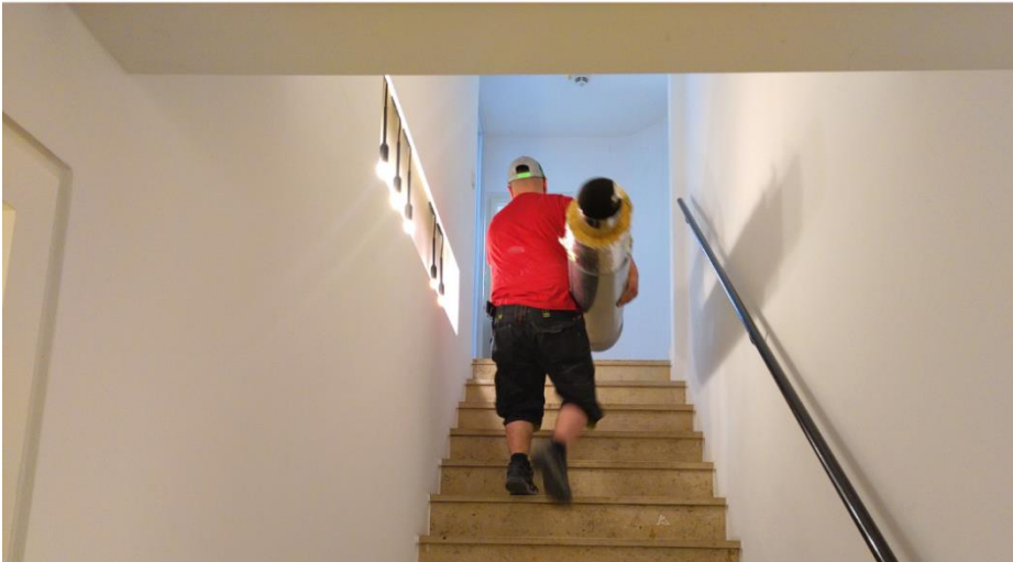
Demontage Gaskessel; Foto: Thomas Lenzen