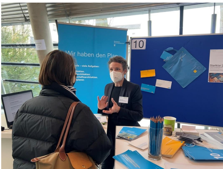
Fachmesse ICOM in München