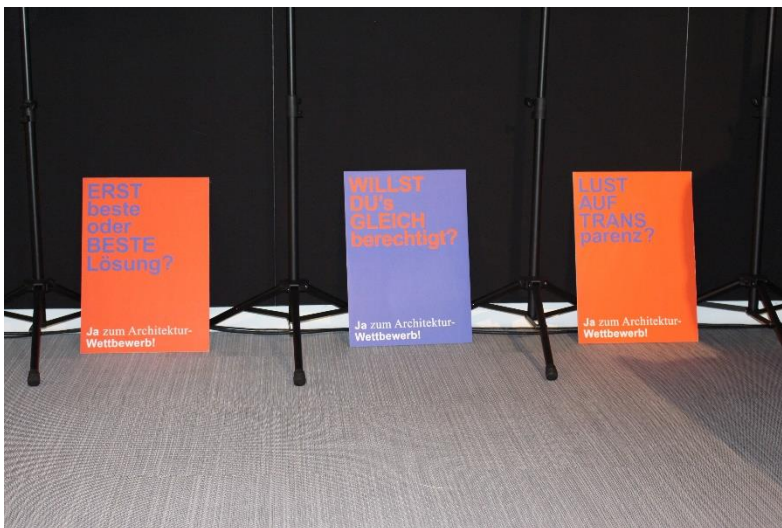
Plakative Slogans für grenzüberschreitende Architektenwettbewerbe

Die Zahl der von der Bayerischen Architektenkammer registrierten Wettbewerbe lag zum 30. Mai 2022 bei 44 Verfahren.