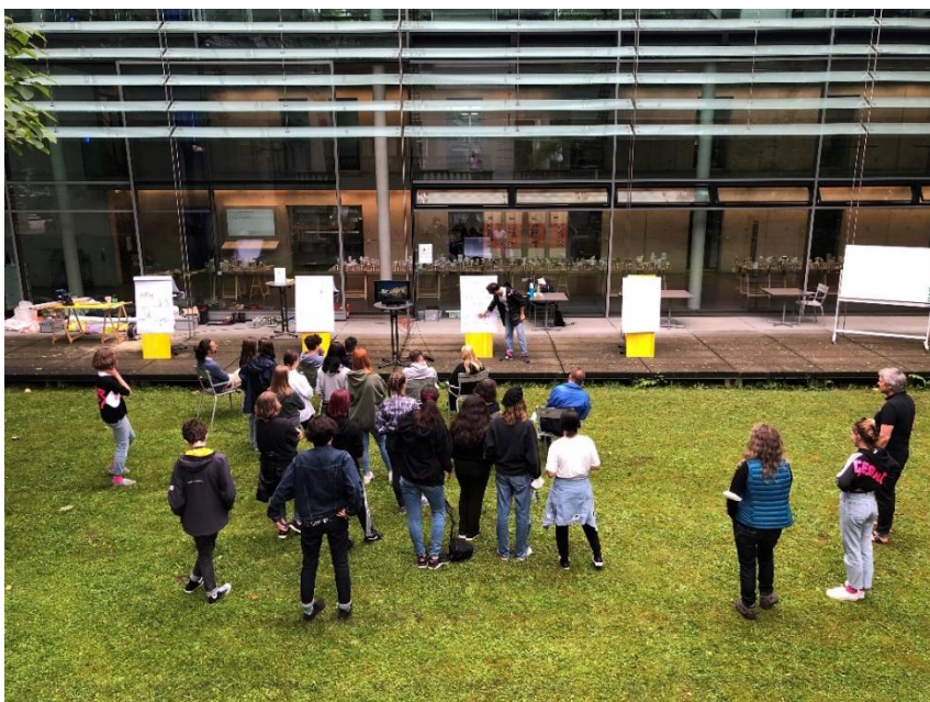
Woche der Baukulturellen Bildung 2021