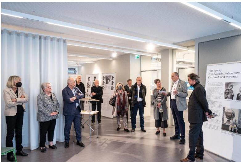
Rundgang durch die Ausstellung Auf AEG

Die im Rahmen einer Kooperation zwischen der Fritz-und-Maria-Koenig-Stiftung, der Stadt Landshut, dem Markt Altdorf, Architektur und Kunst Landshut sowie der Bayerischen Architektenkammer entstandene Ausstellung „Fritz Koenig – The Sphere – Kunstwerk und Mahnmal“ machte von 02. bis 15.05.2022 in den Räumlichkeiten „Auf AEG“ Station.