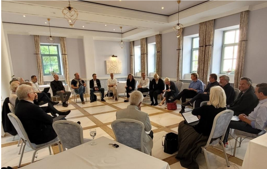
Vorstandsklausur in Dresden