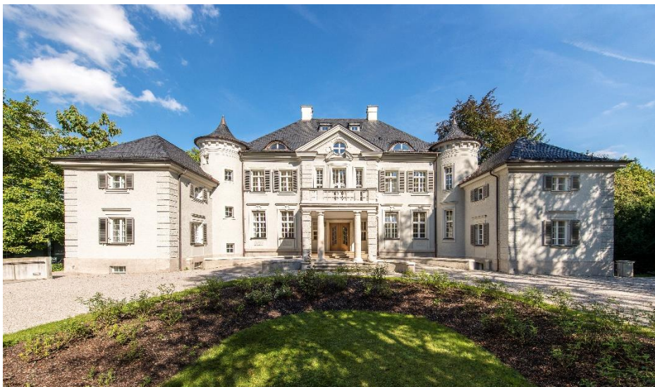
Vorbereich Littmann-Bau; Foto: Thilo Härdtlein

Die Neugestaltung der Außenanlagen im Vorbereich der Liegenschaften wurde durch realgrün Landschaftsarchitekten geplant. Die Baugenehmigung für die Maßnahmen liegt vor.