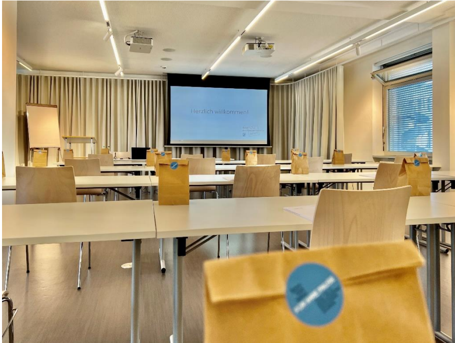
Vorbereitung für die erste Präsenzveranstaltung auf AEG

Mit insgesamt 11.219 TN haben somit rechnerisch 44,2% (ohne die ü. 67-Jährigen sogar 55,8%) der Mitglieder von ihrer Fortbildungspflicht durch Angebote der ByAK Gebrauch gemacht. Der mehrfach bestätigte Beschluss der Vertreterversammlung, keine kontrollierte Fortbildungspflicht einzuführen, solange nachgewiesen werden kann, dass die Mitglieder dieser Verpflichtung auch ohne Kontrolle nachkommen, konnte damit bestätigt werden.