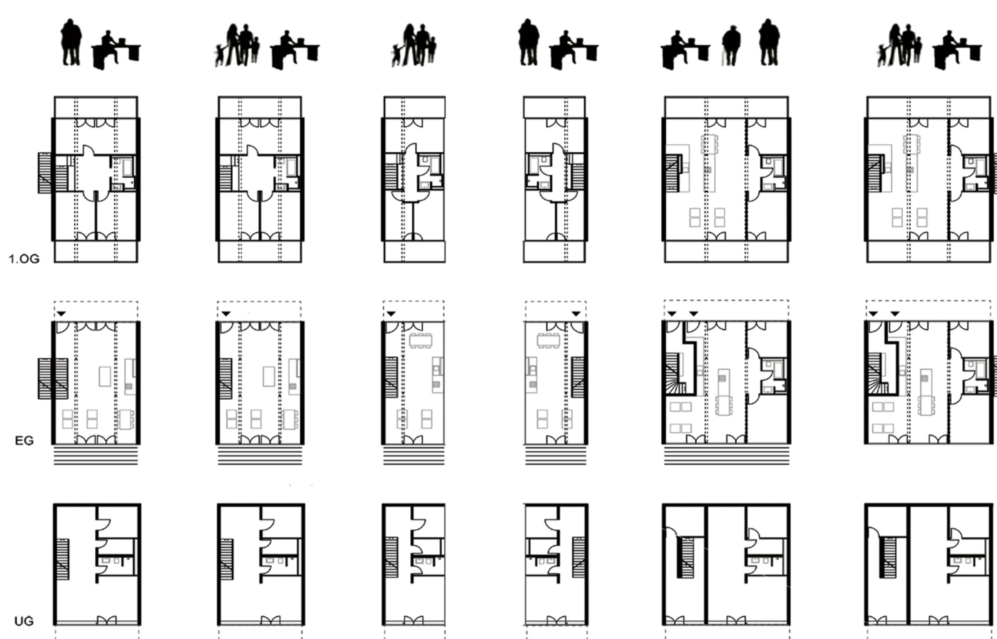
Grundriss Varianten | © Beer Bembé Dellinger Architekten und Stadtplaner