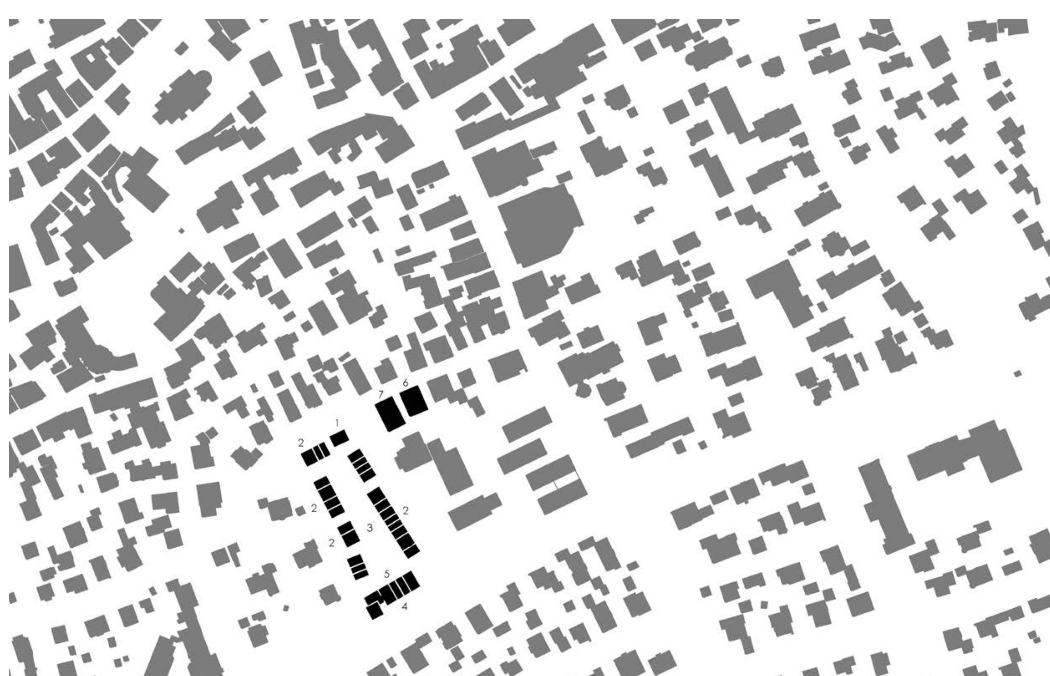
Lageplan | © Beer Bembé Dellinger Architekten und Stadtplaner